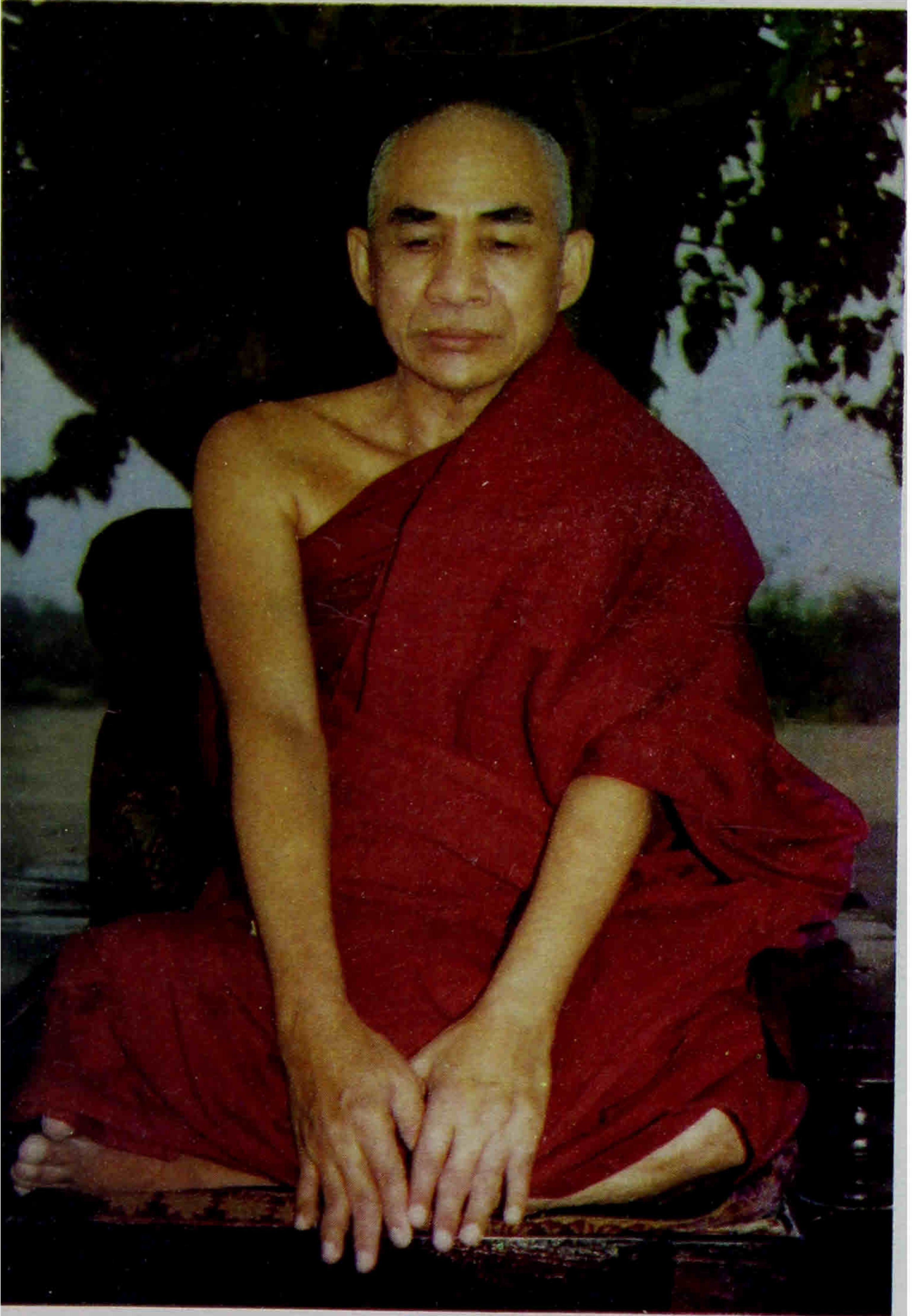
ကျေးဇူးတော်ရှင်မဟာဗောဓိမြိုင်ဆရာတော် ဝနဝါသီဥေယျဓမ္မသာမိထေရ်